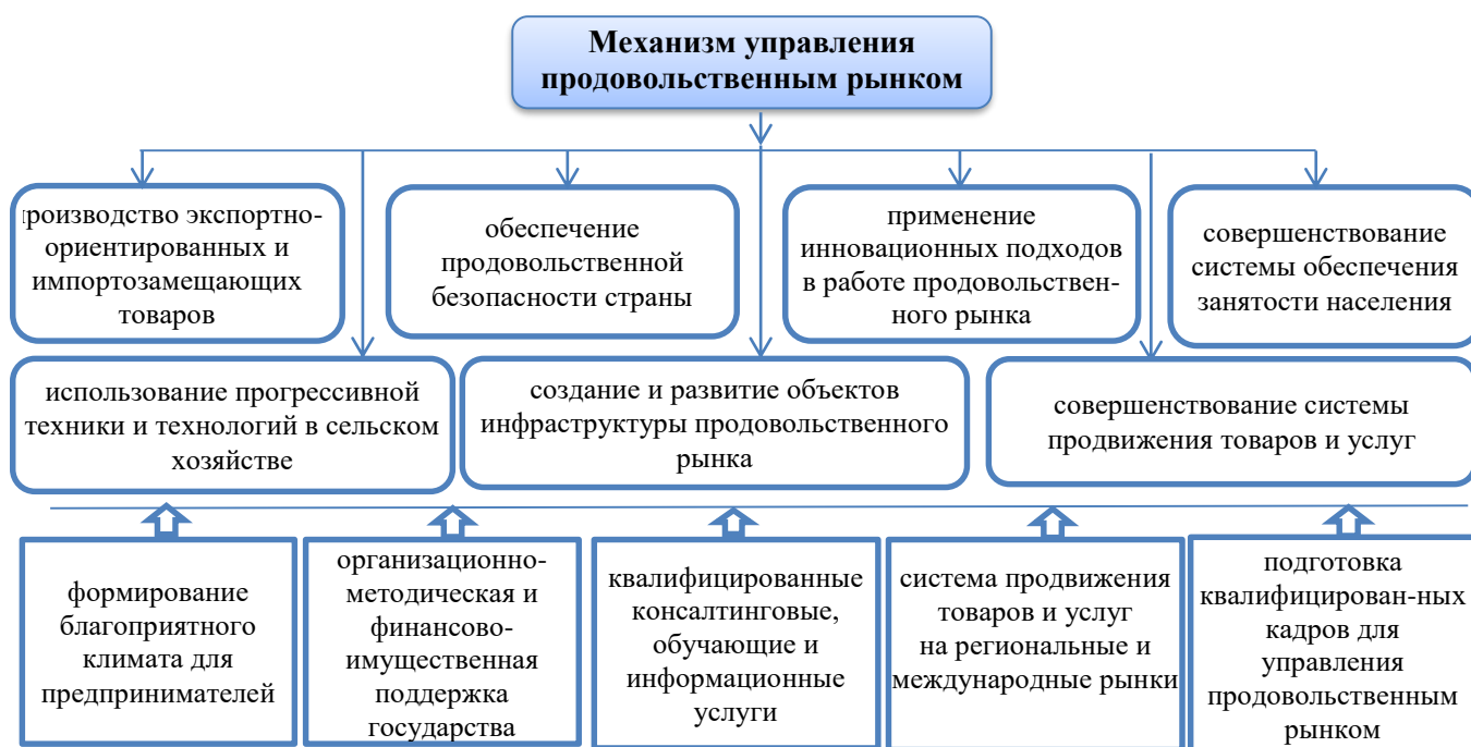
Рисунок 5 - Механизм управления продовольственным рынком Республики Таджикистан (составлено автором)

По мнению автора предложенный механизм позволит усовершенствовать работу продовольственного рынка страны и регионов (рис.5).