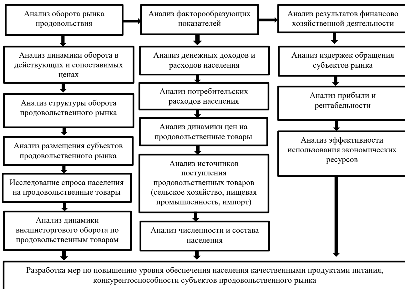
Рисунок 2 - Блок-схема анализа оборота и конъюнктуры продовольственного рынка (составлено автором)

низким. Вместе с тем, урожайность отдельных сельхозкультур: зерна, овощей, бахчевых культур; плодов, ягод и винограда, кроме картофеля, по регионам за анализируемый период возросла, что создает основу для увеличения объемов производства сельскохозяйственной продукции и обеспечения продовольственного рынка товарами. Сложившаяся ситуация в целом положительно отразилась на динамике валовой продукции сельского хозяйства по республике в целом и регионам как одного из основных источников ресурсного потенциала продовольственного рынка.